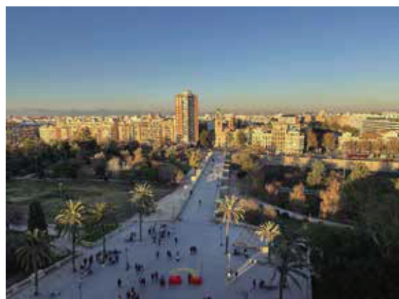
瓦倫西亞是西班牙第三大城市，第二大海港，號稱歐洲的「陽光之城」。