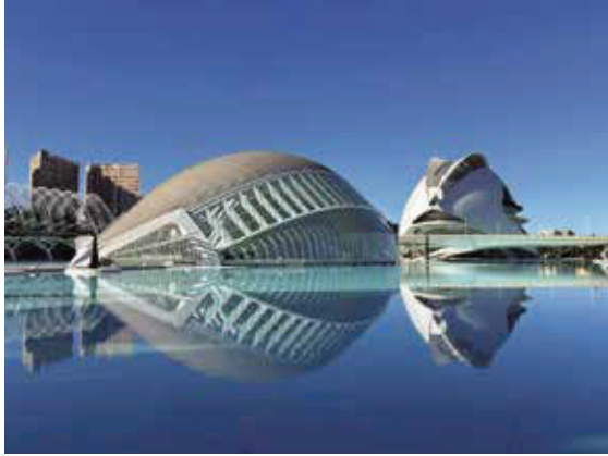
藝術科學城是西班牙12大寶藏之一，也是到瓦倫西亞一定要朝聖的地方。