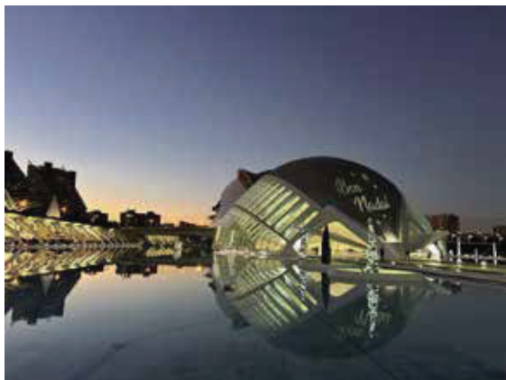
大眼球天文館是一座壯觀的標誌性建築。