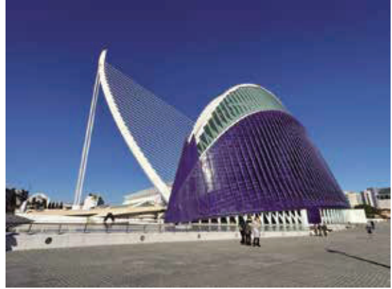
擁有三個獨具特色的子景點，是瓦倫西亞充滿藝術美感的建築群。