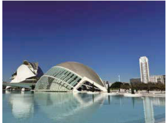
白色的建築群與藍色的天空和湖水相得益彰，每一幀都是鏡頭捕捉的美景。