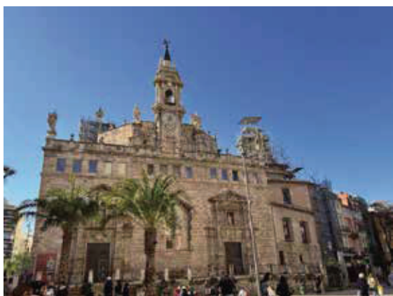
瓦倫西亞天主教堂。