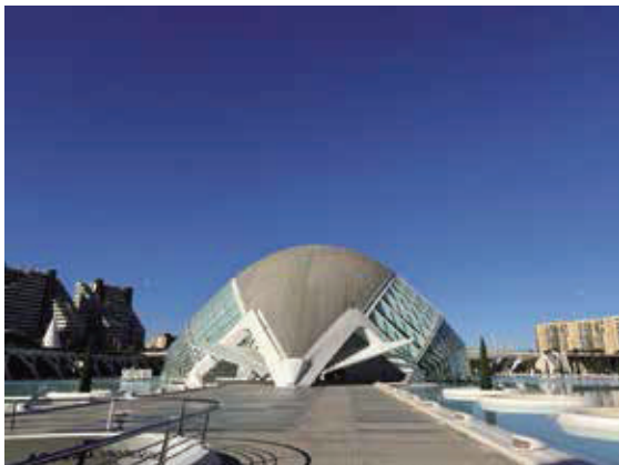
建築群由六個空間組成：天文館、科學博物館、水族館、歌劇院、露天花園及多功能館。