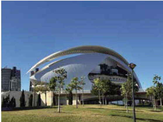
佔地超過35萬平方米，建築風格獨樹一幟，是攝影、藝術愛好者的天堂。