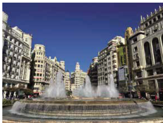
市中心廣場噴水池。