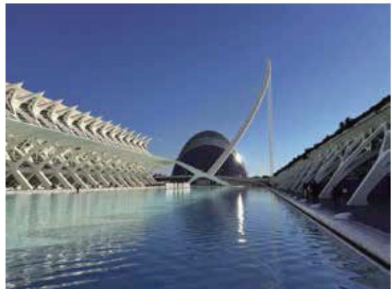
費利佩王子科學博物館。